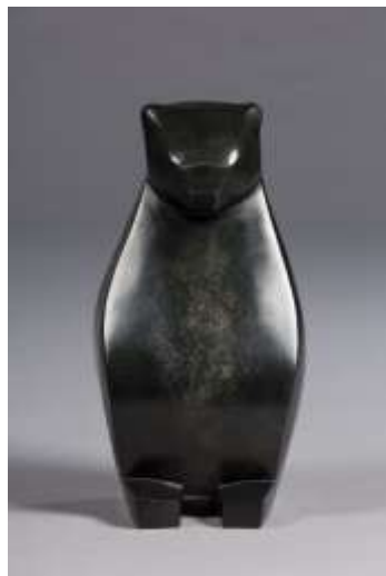
Prosper, bronze patiné 2014