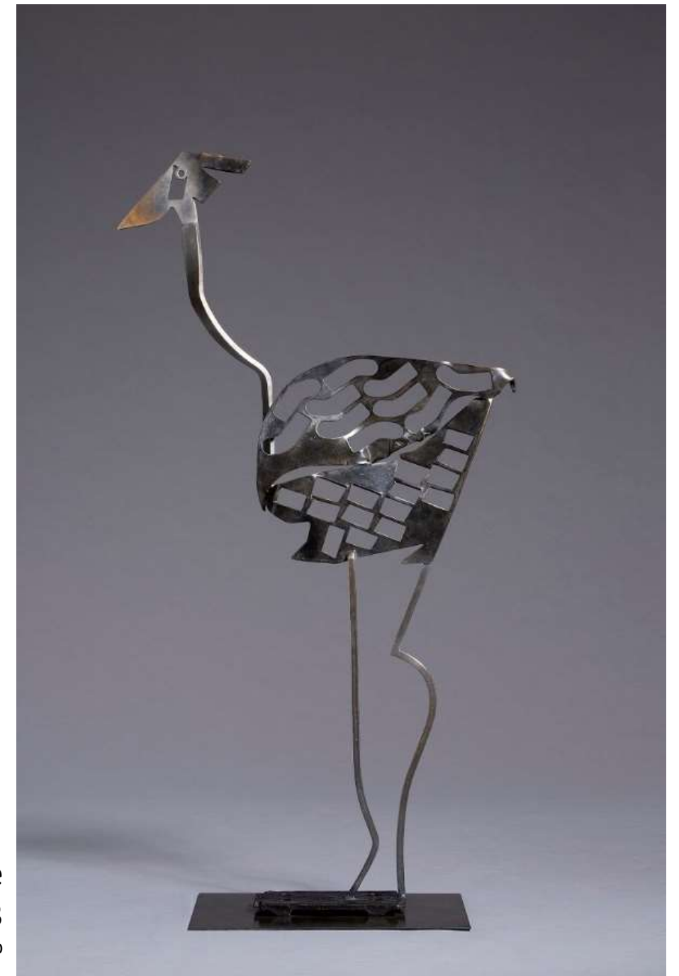
Tara, bronze patiné 2013 145hx50lx50p