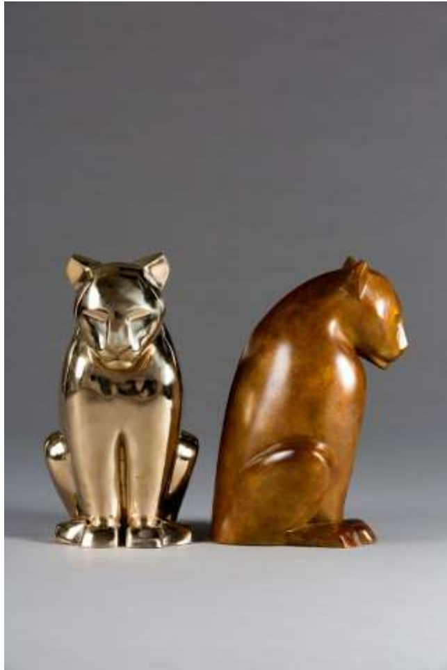
Lionnes Serena, bronze poli et patiné 42hx24lx27p