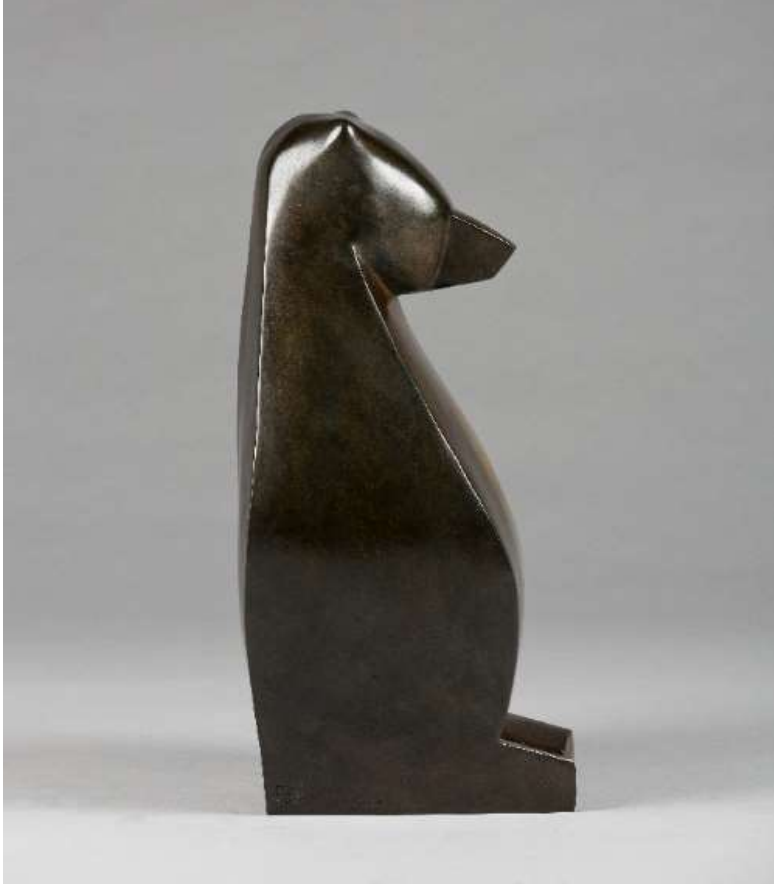
Rosa, bronze patiné 2016