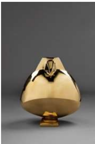
Paloma, bronze poli 2014 26hx25lx21p

« En cela elle se rapproche de la ligne de François Pompon, d'autant plus que ses bronzes sont polis ou patinés soigneusement, comme ceux du sculpteur sédécien », commenté Cyril Brulé.