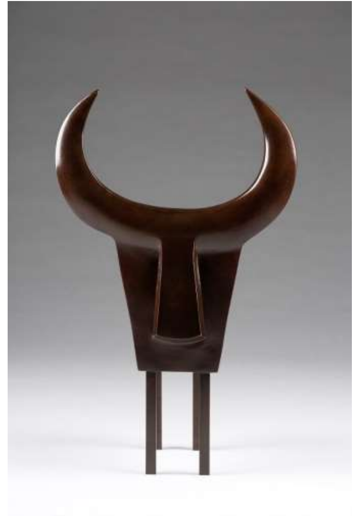
Macho, bronze patiné 46hx29lx27p