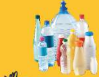
BOUTEILLES, FLACONS EN PLASTIQUE