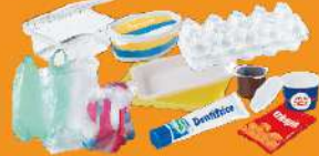
TOUS LES EMBALLAGES EN PLASTIQUE : SACS, SACHETS, FILMS, BOÎTES, POTS, TUBES ET BARQUETTES...

*Un emballage sert à protéger les produits alimentaires ou autres Une question sur le tri ? triercestdonner.fr