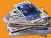
TOUS LES PAPIERS, JOURNAUX, MAGAZINES