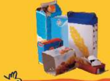
EMBALLAGES EN CARTON ET BRIQUES ALIMENTAIRES