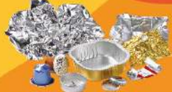
PETITS EMBALLAGES MÉTALLIQUES